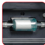
Analizzatore gas HFO o R134a