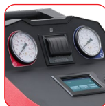
Touchscreen da 4,3"