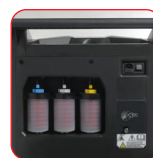
Recipienti ermetici e riutilizzabili