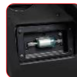
Analizzatore gas HFO o R134a