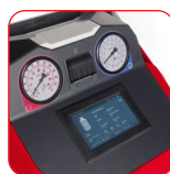
Touchscreen a colori da 7"