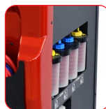
4 linee separate