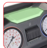
Spia di stato