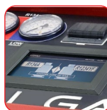
Touchscreen a colori da 7"