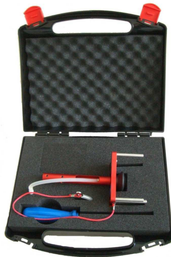
09807-10 Distronic plus Dispositivo di adattamento