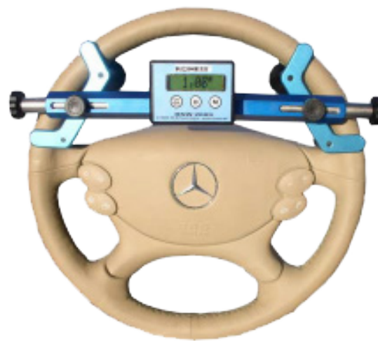
20090-10 Allineamento dello sterzo ruote con inclinazione elettronica RNW 2009