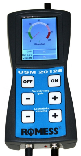
20128 Prova perdite ad ultrasuoni