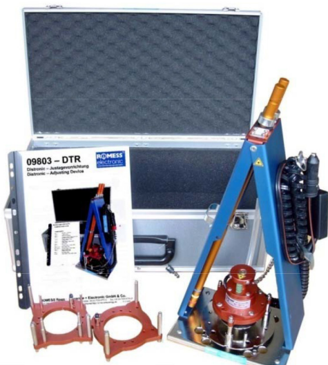
09803 Distronic Dispositivo di adattamento